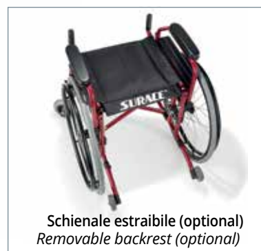
Schienale estraibile (optional) Removable backrest (optional)