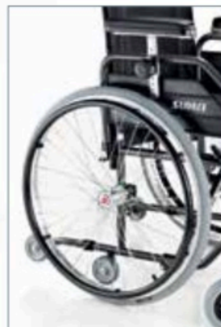
Braccioli regolabili. Kit speed (optional) Adjustable armrests. Kit speed (optional)